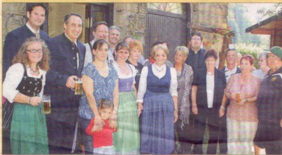
Links: Organisatoren und Aussteller freuten sich über den großen Besucherandrang beim Erntedankfest der Pfarre Rekawinkel.